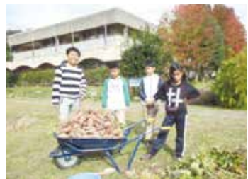
中庭の畑でさつま芋の収穫を 楽しむ子どもたち

等々。にもかかわ らず、神の、その 計らいの中で輝 かねばならない 方が多いのです。 最近、私は17歳 の息子さんを亡く された在留外国籍 の母親の苦しみに 少し与りました。 その子の闘病中 は修道院の話は、 常にその家族に ありました。5年 間入院中の彼の 病室〈宿〉は、カ トリック一色で した。母親がた めらなく、ご絵や ご像を飾り、ク リスマスも復活 も盛大に祝い、 病院のスタッフ までが祈りを共 にして、昏睡の 彼のいる病室が そのまま祈りと 宣教の場でした。