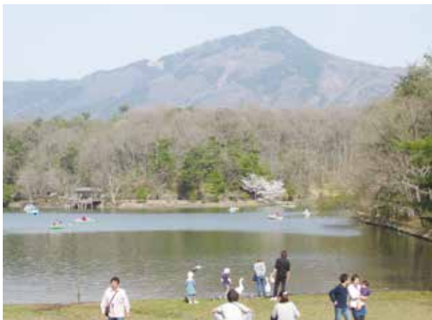
早春の比叡山と宝ヶ池