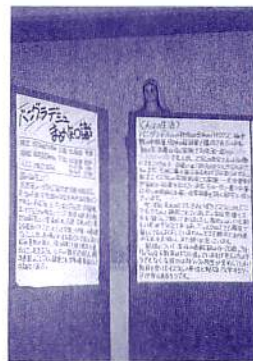
報告会の準備ご苦労さま