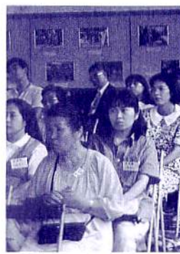
参加者の方々、熱心に聞いて下さいました。