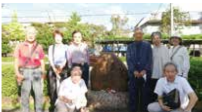
元和殉教記念碑参詣 2024年10月5日

会員の高齢化に伴って、会員人数の減少が進んでいます。若い人たちへの会員募集呼びかけが欠かせません。興味関心のおありの方は、ぜひ一緒に活動いたしましょう。