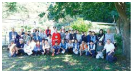
河内キリシタン祈念祭 2024年10月12日