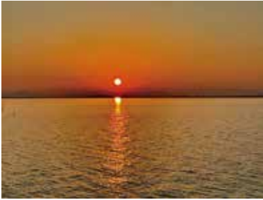
祈りの家から望む琵琶湖の朝日